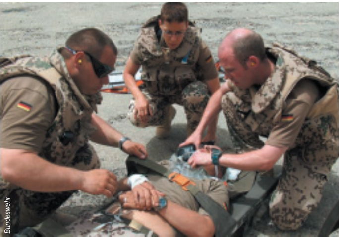
Rettungsanker: Eine qualitativ hochwertige sanitätsdienstliche Versorgung stärkt nachhaltig die Motivation