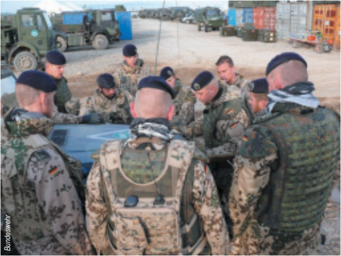
Stark im Team: Vorgesetzte stärken durch gemeinsames Bewältigen von Belastungssituationen das Vertrauen in die Leistungsfähigkeit der Gemeinschaft